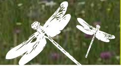
Prairie d'intérêt européen