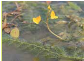
Utriculaire australe (Dupré, CBNBP)