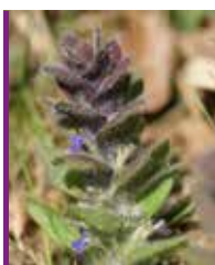
Bugle d'occident (Dupré, CBNBP)