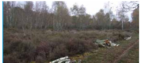
Lande au début des travaux