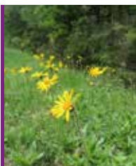
Arnica des montagnes

Deux autres pelouses patrimoniales sont également présentes en Sologne mais de façon anecdotique, la pelouse sablo-calcaire et la pelouse mésophile sur sol marneux. La première se trouve sur des sables mobiles secs et la deuxième sur les sols marneux frais à sec. Ces deux pelouses peuvent potentiellement être observées dans la partie Ouest/Sud-Ouest du territoire.