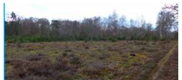
Lande restaurée (5 ans après les travaux)