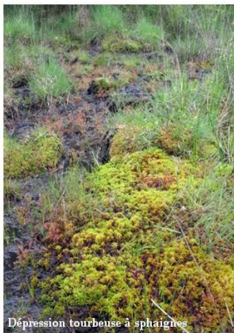
Dépression tourbeuse à sphaignes