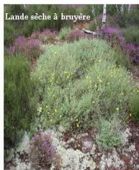
Lande sèche à bruyère