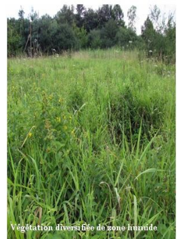
Végétation diversifiée de zone humide

La mesure vise donc à maintenir ces habitats ouverts voire à restaurer les plus enfrichés en combinant des actions de coupe, d'arrachage, et/ou de dévitalisation des sujets ligneux.