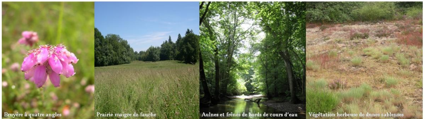
Bruyère à quatre angles