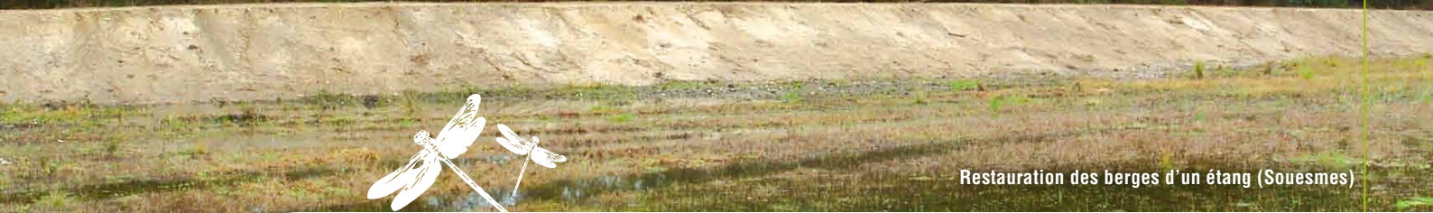
Restauration des berges d'un étang (Souesmes)

Principal outil de préservation volontaire de la biodiversité, les contrats Natura 2000 permettent aux propriétaires, privés ou publics, d'entretenir ou de restaurer des milieux remarquables et de bénéficier d'une prise en charge à hauteur des travaux engagés. En Sologne, après trois ans d'animation, les premiers chantiers voient enfin le jour. Voici un tour d'horizon de ces actions concrètes qui donnent à la démarche Natura 2000 tout son sens.