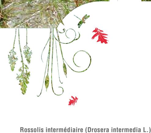
Rossolis intermédiaire ( Drosera intermedia L.)

Tremblant tourbeux avec ses linaigrettes et son trèfle d'eau (Cheverny)